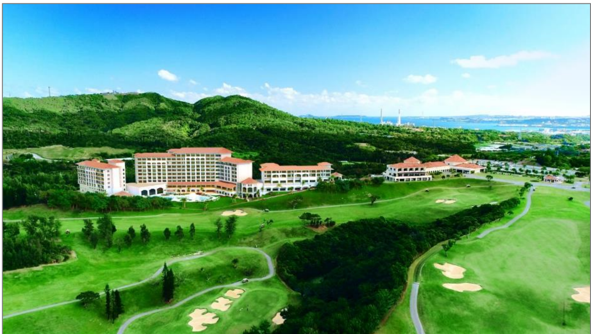
ホテル全景（イメージ）

本ホテルが併設される「PGMゴルフリゾート沖縄」は、2017年に青木 功プロがコースを改造監修して以来、地元沖縄の方から観光客まで、多くのゴルファーに利用されています。本ホテルを開業することにより、ゴルフ場を併設した唯一無二のラグジュアリー総合リゾート施設として、「訪れるたびに新たな感動に出会う楽園」を提供してまいりますので、ぜひご期待ください。