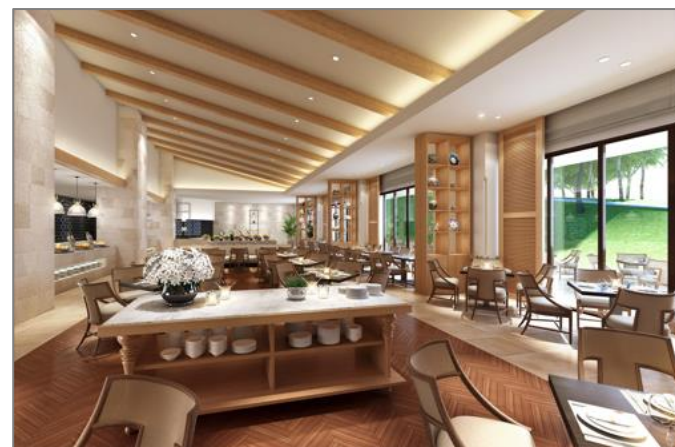
オールデイダイニング