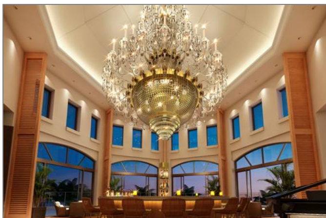
シャンデリアバー