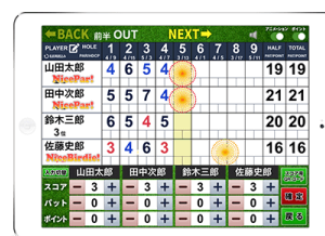
株式会社テクノクラフト 「マーシャル-Ai(アイ)」